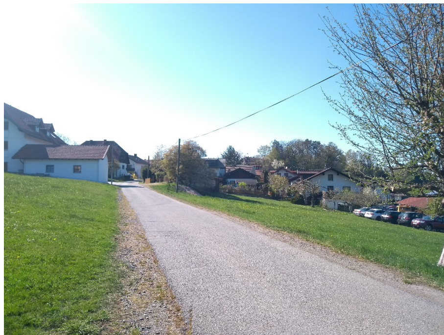
Blick von Osten auf den Ortsrand und die einzubeziehende Fläche (Bildmitte). Aufnahmedatum 20.04.2020

Das Gelände fällt nach Nordosten ab. An der Südwestecke an der Straße beträgt die Höhenlage des Grundstückes etwa 563 m üNN und fällt zur Nordostecke auf etwa 559 m ab.