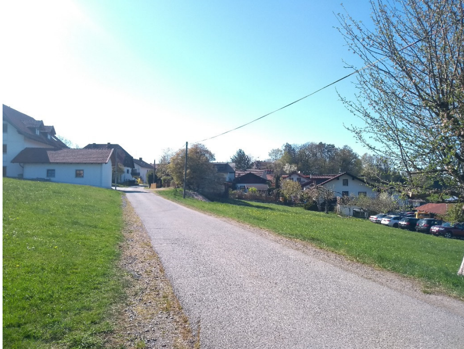
Blick von Osten auf den Ortsrand und die einzubeziehende Fläche (Bildmitte). Aufnahmedatum 20.04.2020

Das Gelände fällt nach Nordosten ab. An der Südwestecke an der Straße beträgt die Höhenlage des Grundstückes etwa 563 m üNN und fällt zur Nordostecke auf etwa 559 m ab.